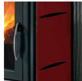
CERAMICA ROSSO BORDEAUX (CON CAVILLO)