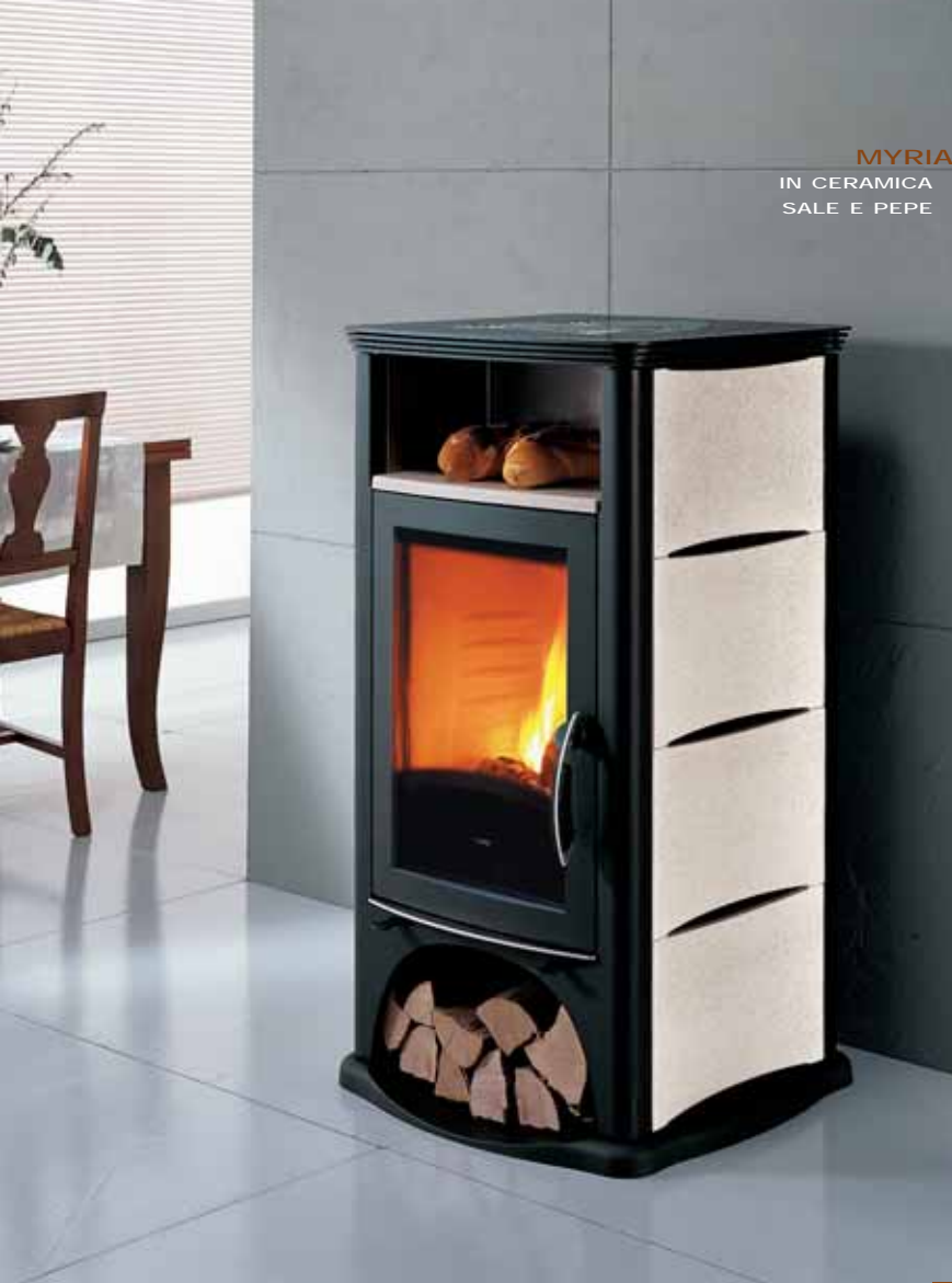
MYRIA IN CERAMICA SALE E PEPE

Myria si caratterizza per la presenza di un vano scaldavivande dall'altezza utile di 185 mm., abbastanza grande da contenere un gran tegame o una pentola. Al proprio interno vi è un piano di cottura in ceramica anticavillo, cioè senza microfessurazioni dello smalto che portano nel tempo ad antiestetiche e non igieniche crepe di colore scuro.