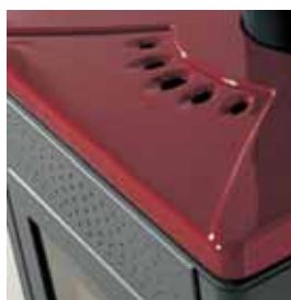
ROSSO BORDEAUX (CON CAVILLO)

I dati sono rilevati in laboratorio usando legna di faggio con P.C.I. di 3.500 Kcal/kg.